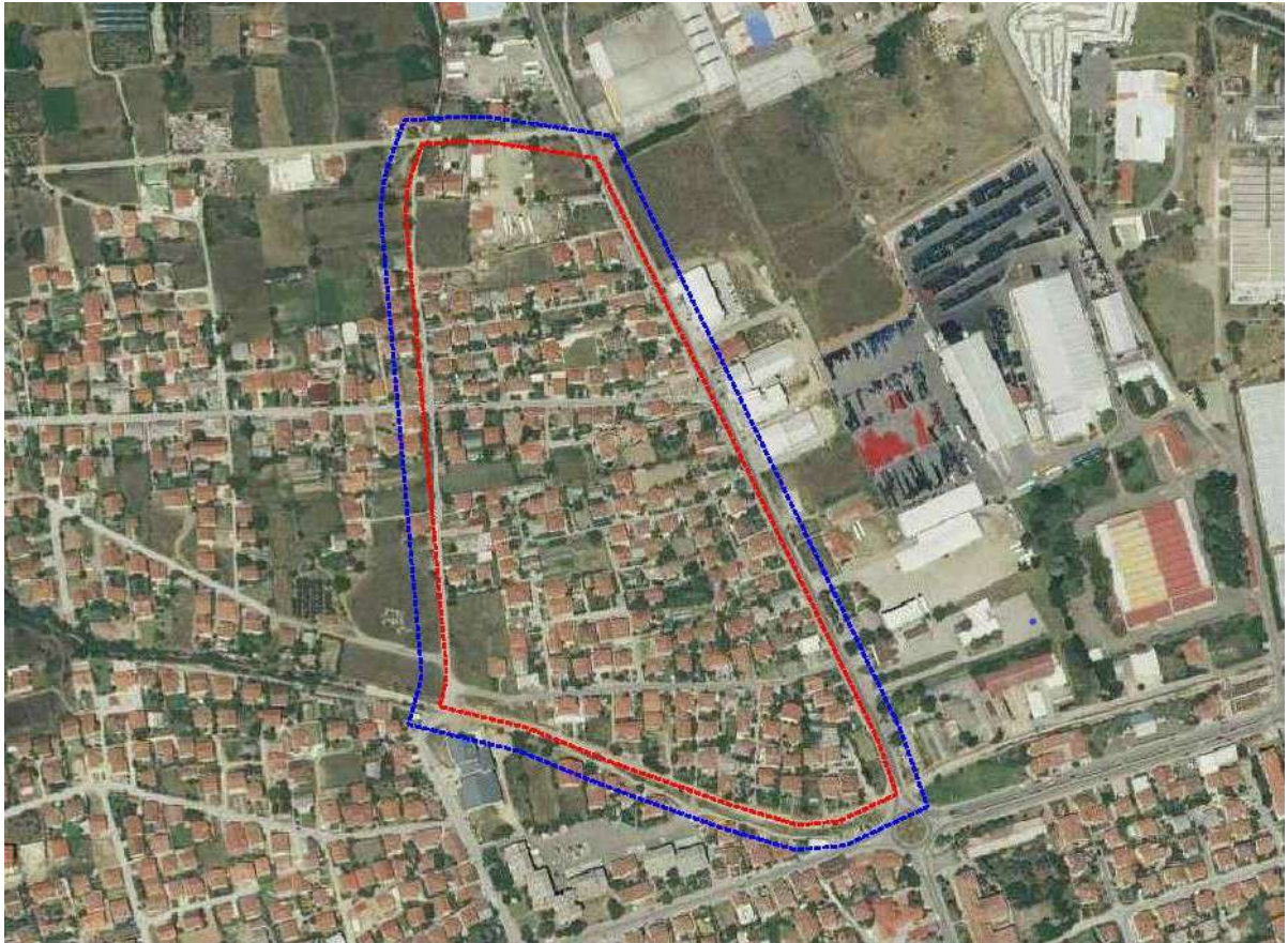
местоположба на плански опфат

Опфатот на Детален урбанистички план за блок 7.3, Општина Гевгелија е сместен во северниот дел на град Гевгелија, во рамки на Општина Гевгелија. Локалитетот претставува изградено земјиште.